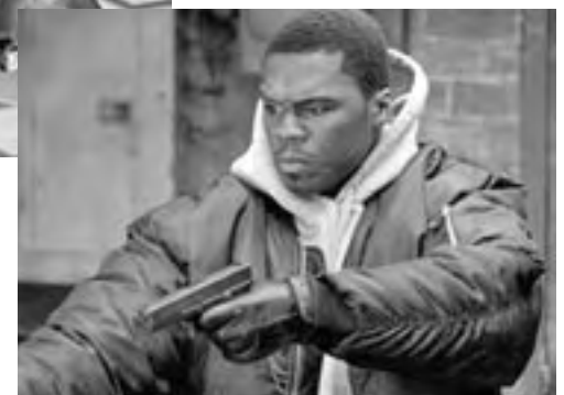
Get Rich or Die Tryin'